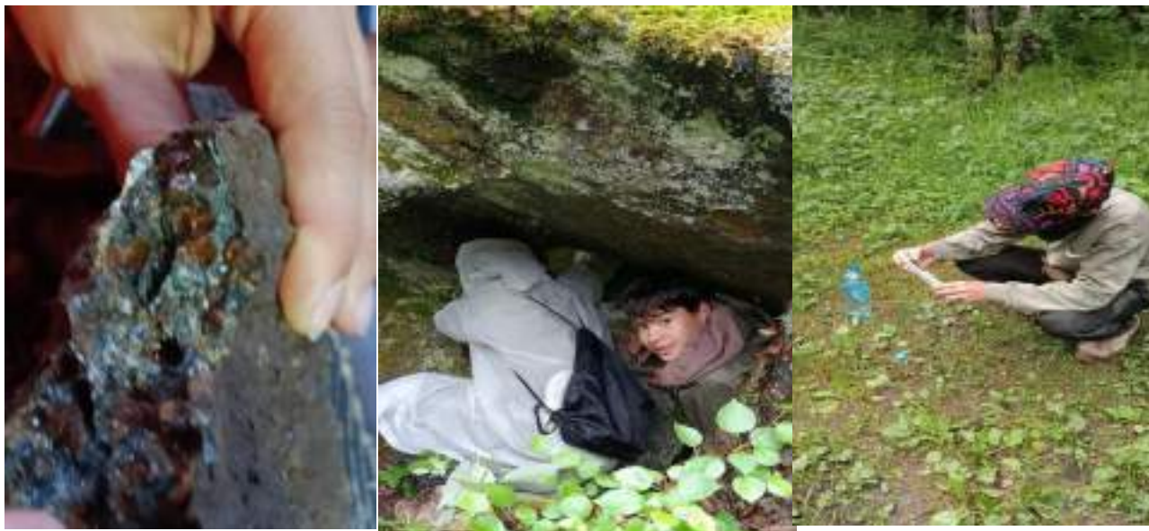
Фото 1-8 Краеведческая, геологическая работа с минералами, их поиск

Около 14.45, группа набрав воды с продолжила свой путь до приюта «Гремучий ключ». Предстояло пройти еще порядка 2, 5 км, причем от приюта есть два пути - один по куруму без сброса высоты и короче на 500 метров, второй более пологий по тропе. Было решено выбрать второй путь так как ,на куруме проваливаться между камней было неудобно и увеличило бы время прохождения пути.