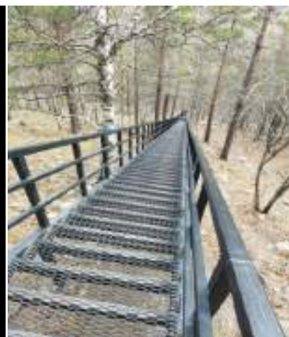
Фото 1-8 Лестница к площадке

Половину пути группа поднималась по лестнице, а остальную половину уже шли с уклоном под 45 градусов по горе. И вот наконец-то ребята поднялись на вершину, фотографировались, насладились видом и пошли вниз. Пока шли наверх накрапывал дождь и по условиям безопасности, мы понимали, что вверх к «Перьям» идти не получится, но как только закончилась железная лестница, на небе проступил просвет и пока у нас был привал ветер, разогнал тучи. Участники долго еще смеялись поговорке «дорогу осилит идущий»