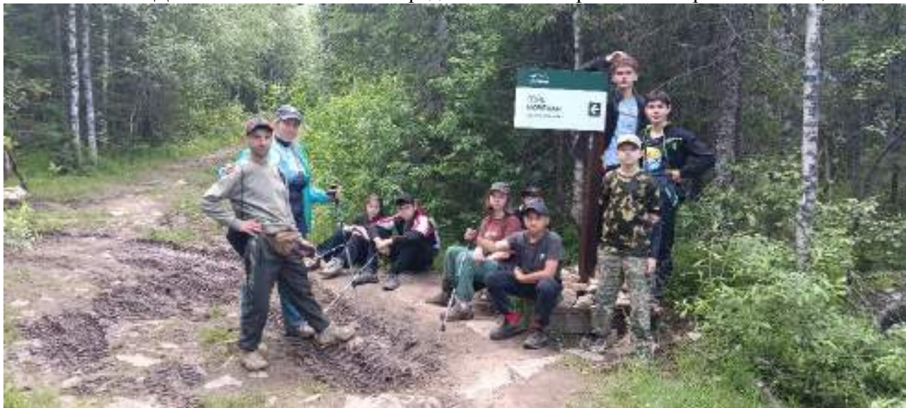
Фото 5-2 Развилка на «Монблан»

Монблан. До Монблана предстояло пройти ровно 6,5 км.