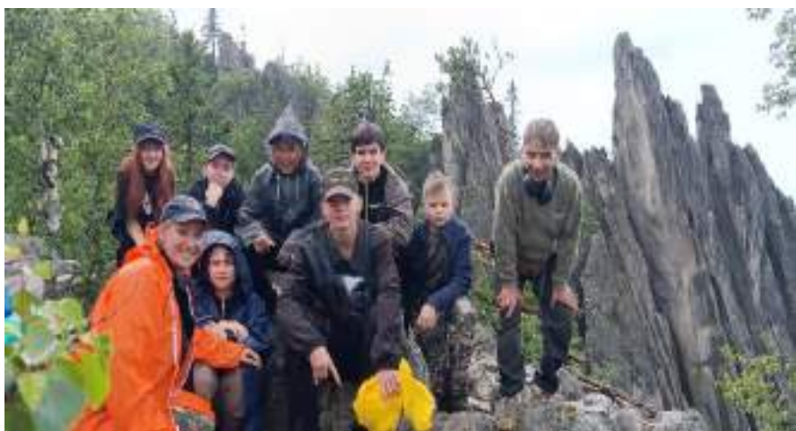
Фото 1-7 Обзорная площадка скалы «Перья»

После моста группа прошла еще 2,5 км и первым приютом на пути оказался «Белый ключ», где решено было сделать перекус и подняться после на гору Двухглавая сопка, со стороны останцев, которые называются «Перья».