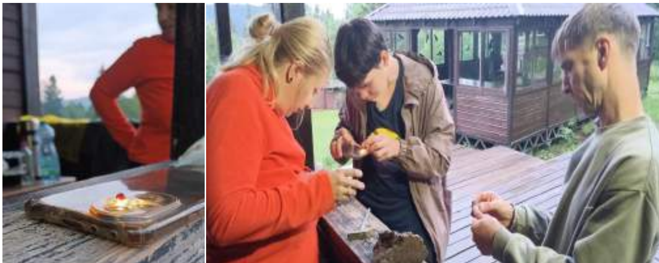
Фото 1-10 Гранатовые россыпи

Характеристика участка: хвойный лес, еловый; набор высоты начинается в основном после р. Бол. Тесьма; курумники на участке от Белого ключа до Гремучего ключа.