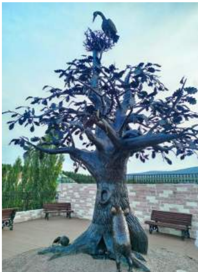
Фото 6-4 Горный парк имени П. П. Бажова