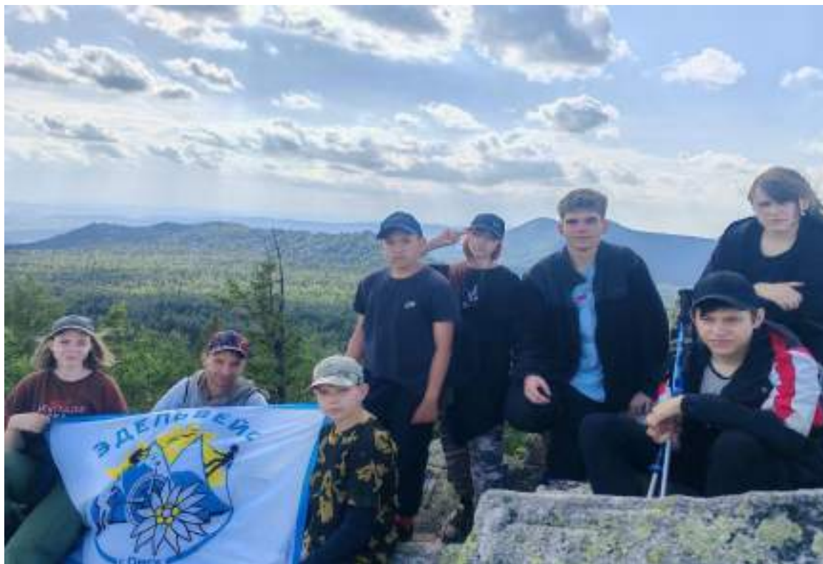
Фото 5-4 Вершина Монблан

Поднялись наверх, запечатлели себя и уже где-то увидели дымок от города Златоуст. Ветер разогнал тучки и было интересно посмотреть на другие вершины и сверить их нахождение по карте. Вниз спускались той же тропой. Уклон на тропе небольшой (не более 10 градусов), но постоянный.