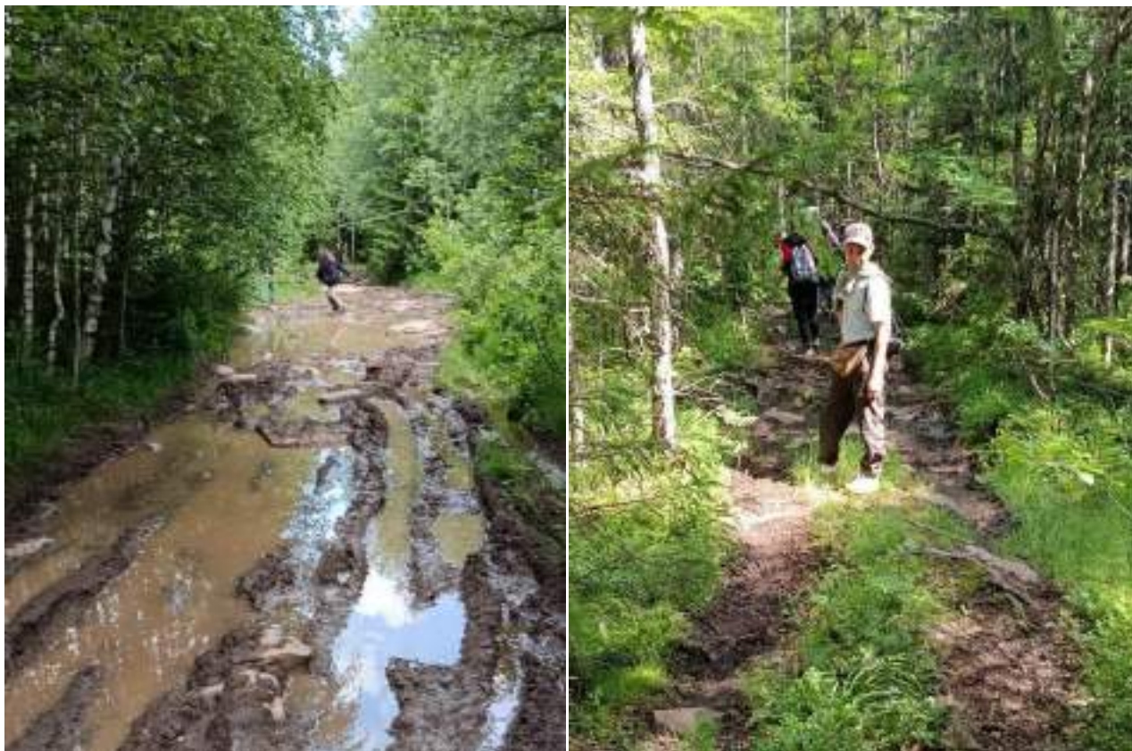
Фото 5-3 Топи и затопленная дорога

Гора Монблан находится на хребте, который является северной частью Уральского хребта, вершина высотой около 1033 метров, получившая своё название в шутку из-за сходства с альпийским массивом, но расположенная в Челябинской области. С ветром здесь действительно все в порядке. С вершины Монблана открывается величественный вид на Большой Таганай и окружающие его вершины. После развилки на Монблан, первые 700 метров представляли собой не тропу, а реку с выступающими камнями. О сухой обуви уже даже не мечталось. После первого километра тропа стала уже более сносной и грязной, и воды стало меньше. Тропа хорошо маркируемая и понятная, практически весь отрезок пути составлял лесной массив и лишь последние 150 метров курум.