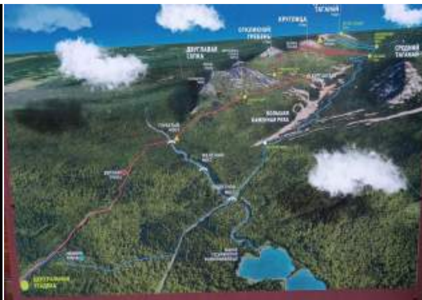
Фото 1-4 Первые километры от Усадьбы Фото 1-5 Обзорная карта «Таганай», акцент на красную линию «верхней тропы»

Через 4 км следования по маршруту, группа подошла к подвесному Горбатому мосту, который является интересным объектом, там ребята набрали воды в реке Большая Тесьма и сделали небольшой привал. Чем выше уходила «верхняя тропа», тем сильнее шел дождь, идти с рюкзаками после привала на мосту стало тяжелее, так как начался 700 метровый подъем вверх с уклоном тропы порядка 30 градусов, для новичков, этот участок дороги стал запоминающимся.