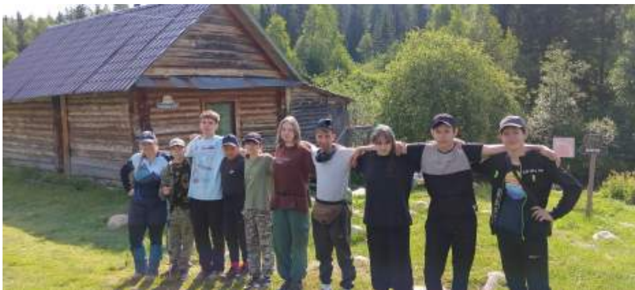
Фото 4-6 Киалимский кардон, выход на Метеостанцию

Подъем в 8:00. Ребята уже точно знали откуда от приюта Таганай до Киалимского приюта на дороге были сложены бревна из сосен, загадка очень легко раскрывалась - это была дорога. Конечно, многие ребята были подготовлены и задавали вопросы не только известные по сайтам про Таганай. Увлечшись познавательной беседой ребята, выдвинулись на гору Метеостанция. Огибая ручьи и новые дождливые реки, которые разлились после ночного дождя, путь в 7 км ребята преодолели за 2.15 минут часа, с тремя привалами по 10 минут. Дорога подымалась вверх, и на последнем километре туристы увидели как меняется хвойный лес на таежную зону с карликовыми елями. Наверху дул легкий ветер, что очень редкое явление для этой горы. Руководители были очень удивлены, а участники просто приняли этот подарок погоды - как данность