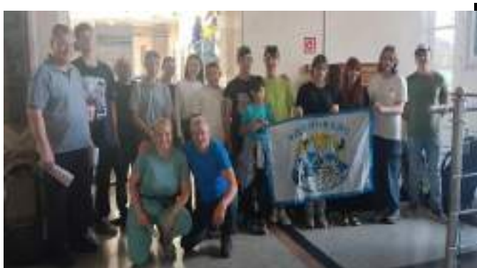
Фото1-1 Выезд из Омска

21 июня в 19.45 группа туристов села в поезд по маршруту следования «Омск - Златоуст», в пути просмотрели еще раз рюкзаки участников на предмет лишней одежды и весомых ненужных личных вещей. Вечером просмотрев карты легли спать, чтобы утром в 8.15 выйти на вокзале города Златоуст и начать свой основной маршрут.