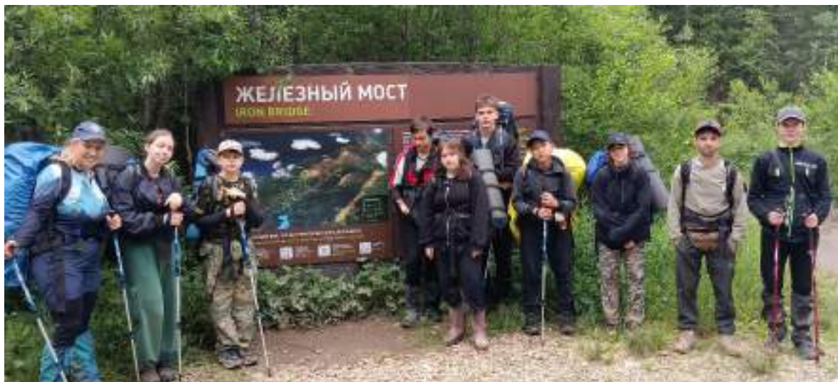
Фото 6-3 Железный мост

Пообедав, группа через 1 км пересекла реку Малая Тесьма через Железный мост и вышла на финишную прямую в Центральную Усадьбу в городе Златоуст.