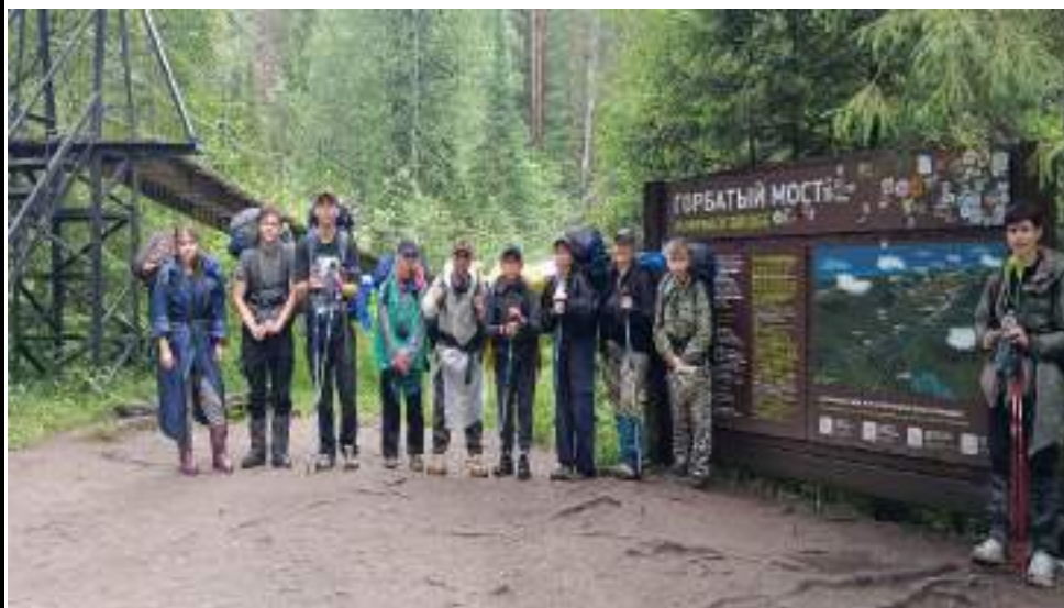
Фото 1-6 Горбатый мост, проходим мост по одному

После моста группа прошла еще 2,5 км и первым приютом на пути оказался «Белый ключ», где решено было сделать перекус и подняться после на гору Двухглавая сопка, со стороны останцев, которые называются «Перья».