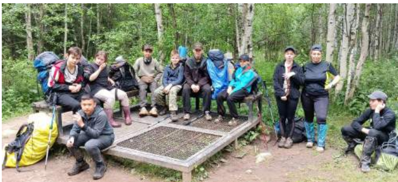
Фото 5-1 Движемся к приюту «Таганай»

Завтрак в 8.00, утро солнечное, собираемся 8 км до приюта Таганай, тропа знакомая. Дорога за эти пару дней стала посуше и темп движения уже с опустевшими рюкзаками весьма порадовал даже самих участников.