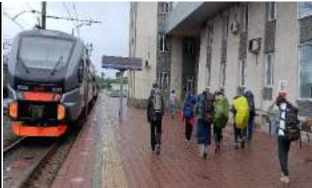
Фото 1-2 Вокзал Златоуста

Утром, 22 июня, уже в славном городе Златоуст, группа пополнив запасы хлеба выдвинулась пешком до Центральной Усадьбы, до которой нужно идти 3 км по городу. В Центральной усадьбе группа зарегистрировалась, ( в этом году бумажной документации стало больше), позвонила в МЧС, оповестив о начале похода и начала свой путь.