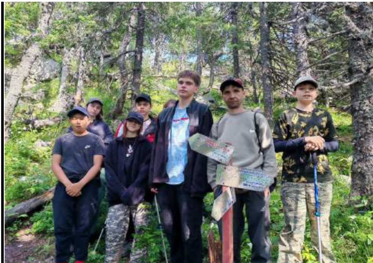
Фото 5-5 Табличка Монблан

Сегодня ребята набрали достаточно дров и отдыхая обсуждали прошедшие дни, пели песни и рассуждали о деревне в Килимских Печах, которая просуществовала так недолго. В 22.00 отбой.