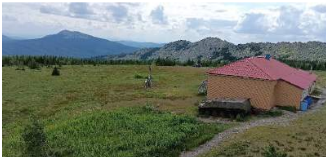
Фото 4-8 Вид на станцию

Примерно в 12:20 с вершины Метеостанции нам открывается прекрасная панорама. Отсюда видно практически весь Таганай. На Метеостанции мы перекусили и провели почти час любуюсь красотой панорамы. Юные геологи отыскивали новые кварцы и гранаты.