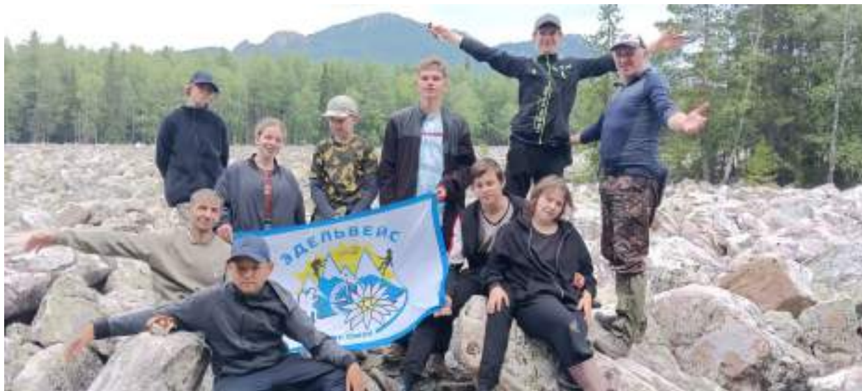
Фото 6-2 Каменная река

Пообедав, группа через 1 км пересекла реку Малая Тесьма через Железный мост и вышла на финишную прямую в Центральную Усадьбу в городе Златоуст.