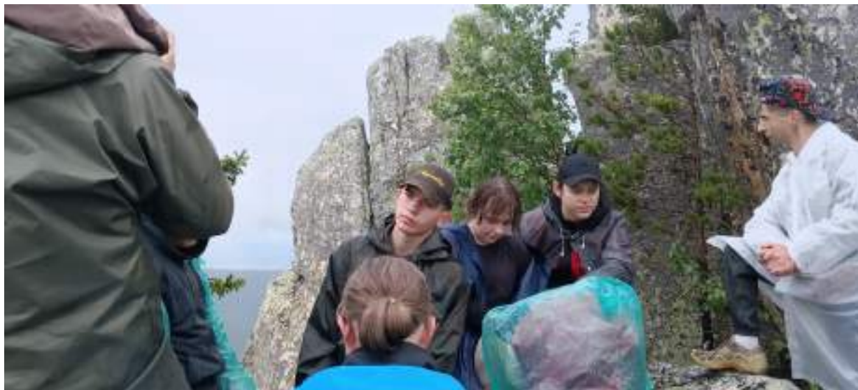
Фото 2-1 Митькины скалы