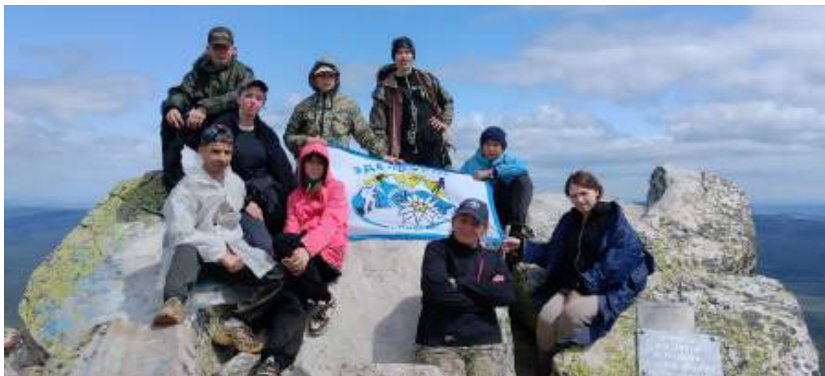
Фото 3-1 Вершина горы «Круглица»

Идем аккуратно, последний участок курума чаще останавливаемся на привал. Обувь на таких участках должна быть с протектором и желательно фиксация голеностопа. Спустя 1,5 часа группа достигла вершины, наверху холоднее и очень ветрено, делаем обзорные фотографии и спускаемся в направлении «Долины сказок» вниз по хребту.