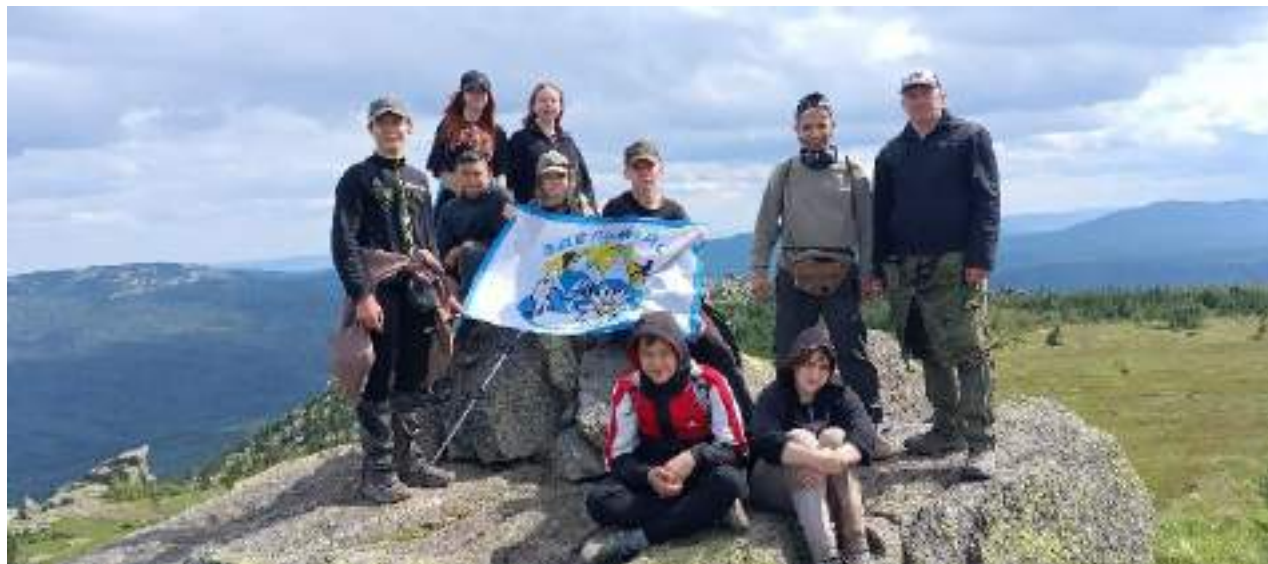
Фото 4-7 Метеостанция. Удивительное безветрие и безмятежность