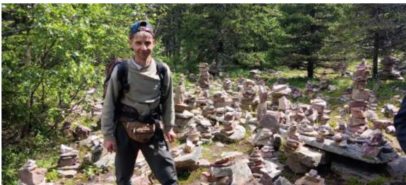
Фото 3-4 Туры в «Долине сказок»

Около 300 метров вниз начинается крупная осыпь, Переходим седловину "Долина Сказок" (есть бело-голубая маркировка, далее отсутствует). Здесь очень много причудливых останцев, делаем немного фото и спускаемся вниз. Двигаемся траверсом по западному склону (крупная осыпь), грязная тропа заставляет нас спускаться ближе к границе леса. Двигаясь по тропе и переходя многочисленные каменные ручьи (курумники), достигаем приюта Таганай в 13.30.