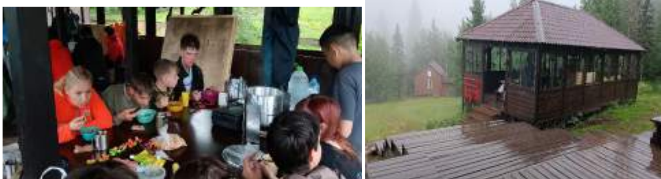
Фото 1-9 Гремучий ключ, прием пищи

Около 14.45, группа набрав воды с продолжила свой путь до приюта «Гремучий ключ». Предстояло пройти еще порядка 2, 5 км, причем от приюта есть два пути - один по куруму без сброса высоты и короче на 500 метров, второй более пологий по тропе. Было решено выбрать второй путь так как ,на куруме проваливаться между камней было неудобно и увеличило бы время прохождения пути.