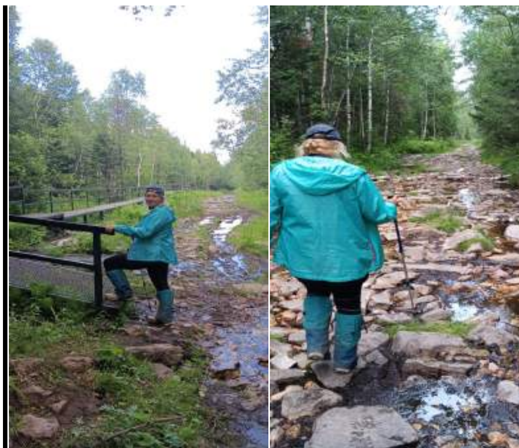
Фото 6-1 Новые железные мосты на «нижней тропе»

Подъем в 8:00. Погодные условия были благоприятные: Ночью осадков не наблюдалось, настроение и сам настрой ребят был боевой, светило солнце. Выдвинувшись всей группой в 9.15, ребята почувствовали на себе разницу между верхней и нижней тропой. Если на верхней тропе были ручьи, но их было совсем не много, то нижняя тропа была залита порядком водой. Несколько болотистых участков было заменено на железные продолжительные мостики, которым были рады все участники. В 2024 году осенью началась технологическая реконструкция парка, и уже 2025 году на нижней тропе появилось три железных сооружения, которые позволяют туристам обходить болото.