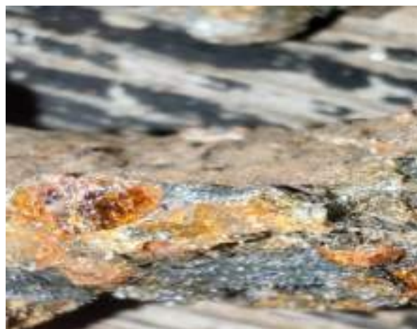
Фото 4-9 Сокровища Таганая

Группа выдвигается в обратный путь другой тропой. Спустившись около 2 км, мы поворачиваем в сторону «стрелки», чтобы выйти на останцы «Три брата.»