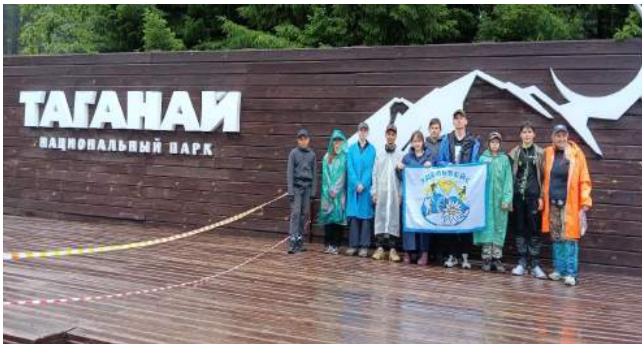
Фото 1-3 старт с Центральной усадьбы «Таганай»

Со старта маршрута начался дождь, переходящий в течение дня в ливень разной интенсивности. Путь был не близким, порядка 10 км по так называемой «Верхней тропе». Температура воздуха в 10.00 была порядка 18 градусов тепла. Почва под ногами была размокшей и вязкой, предыдущие 3 ночи также шел дождь, но мы не унывали, а только сравнивали качество наших дождевиков. Через два часа тропа начала подниматься уверенно вверх и мы преодолели первый «пыхтун», так называемый подъем в 30 градусов на протяжении 400 метров.