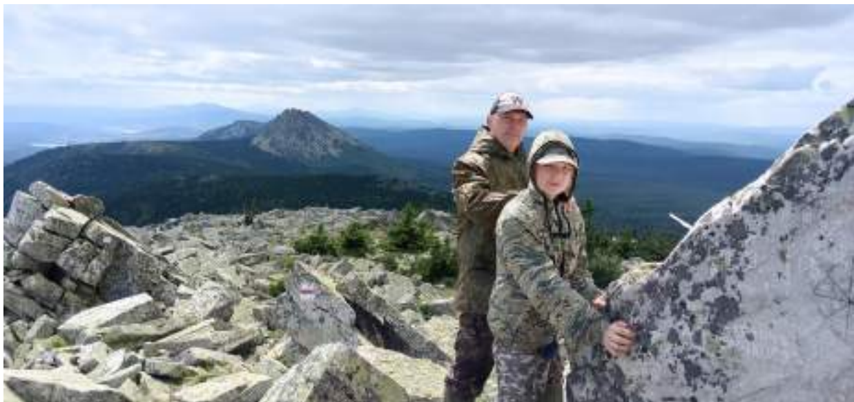
Фото 3-2 Вершина горы «Круглица»

Около 300 метров вниз начинается крупная осыпь, Переходим седловину "Долина Сказок" (есть бело-голубая маркировка, далее отсутствует). Здесь очень много причудливых останцев, делаем немного фото и спускаемся вниз. Двигаемся траверсом по западному склону (крупная осыпь), грязная тропа заставляет нас спускаться ближе к границе леса. Двигаясь по тропе и переходя многочисленные каменные ручьи (курумники), достигаем приюта Таганай в 13.30.