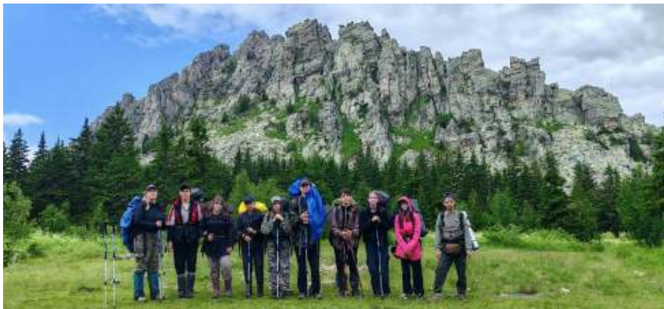
Фото 2-3 Вид на Откликной гребень

Далее повернули на тропу в сторону приюта Таганай, на протяжении 1,5 км сбрасываем высоту, идем галсом, чтобы не травмировать колени, а также так идти безопаснее, вся дорога мокрая. Тропа к приюту местами сильно петляет и круто спускается вниз. Сегодня также идет дождь, вершина парка –Круглица –в тумане и в дожде. Надеемся, что нам завтра повезет и мы поднимемся на гору. Прошли через «Заячью поляну» и спустя 1,5 часа мы уже в приюте. Мы на приюте «Таганай», размещаемся по стационарным палаткам, обедаем или точнее ужинаем и отбой. В эту ночь дети увидели красоту звездного уральского неба.