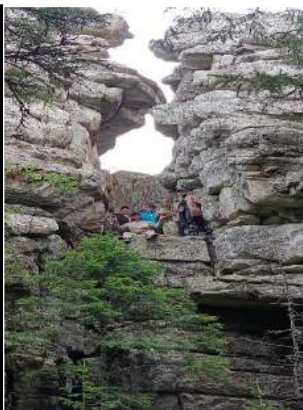
Фото 4-10 Сокровища Таганая