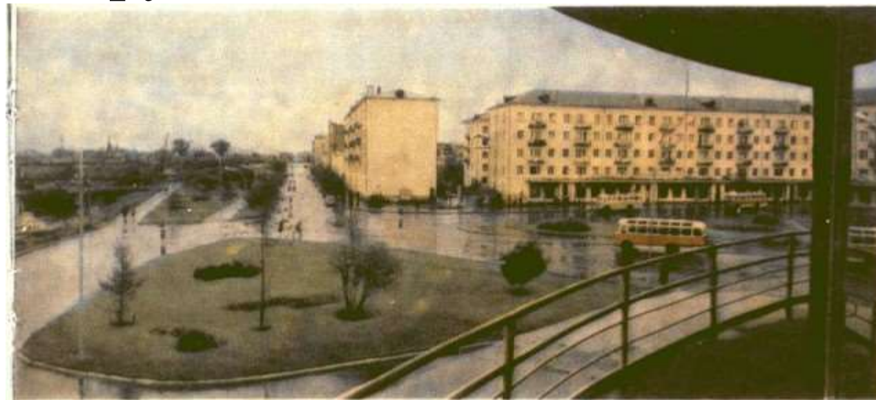
Сквер им. Врубеля 1970 год

Участники экскурсии прогуляются по скверу, узнают в честь кого он назван полюбуются скульптурой, посвящённая любви с первого взгляда. Она называется "Встреча"