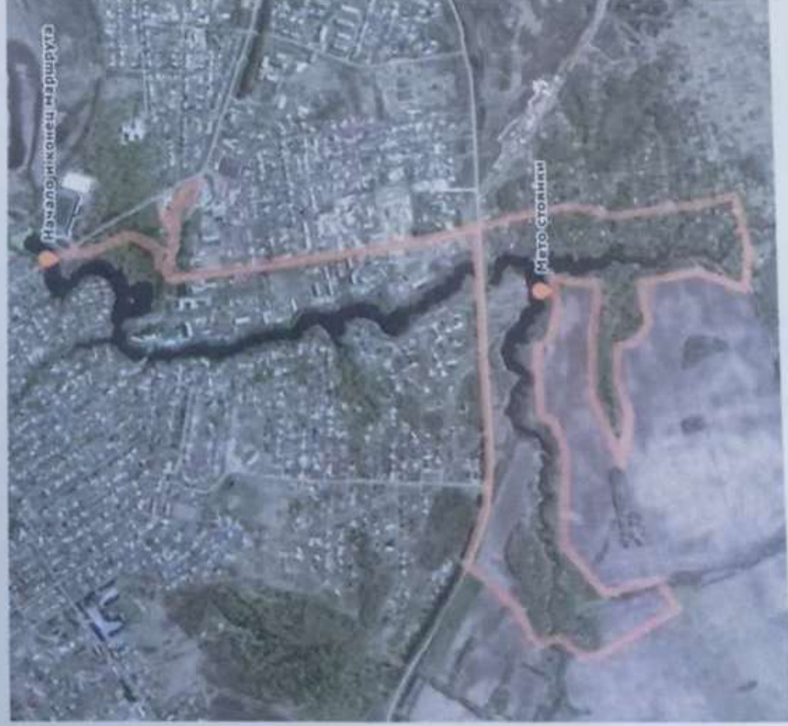
СХЕМА МАРШРУТА ПОХОДА