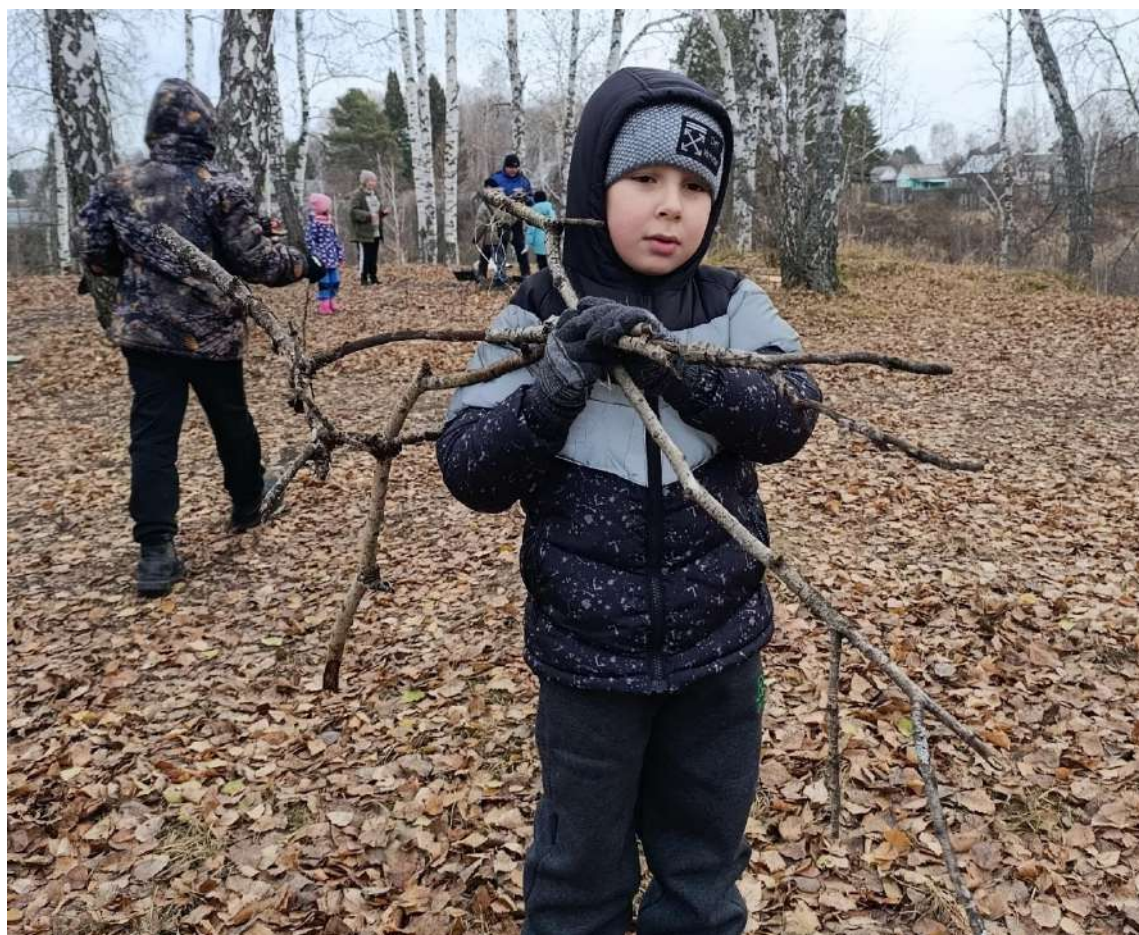
Фото № 6 « Без труда не... горит костер»