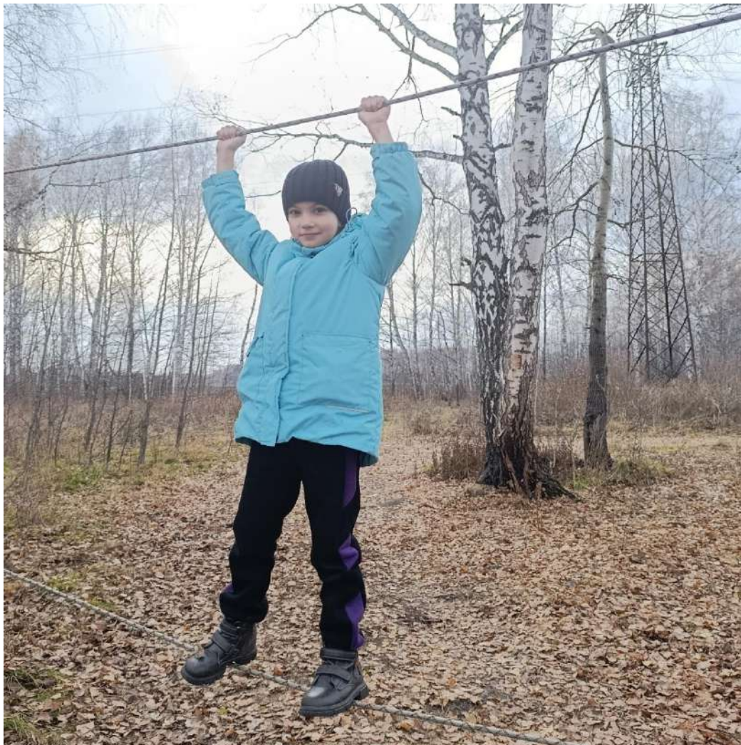
Фото №12 « Учебно-тренировочное занятие»