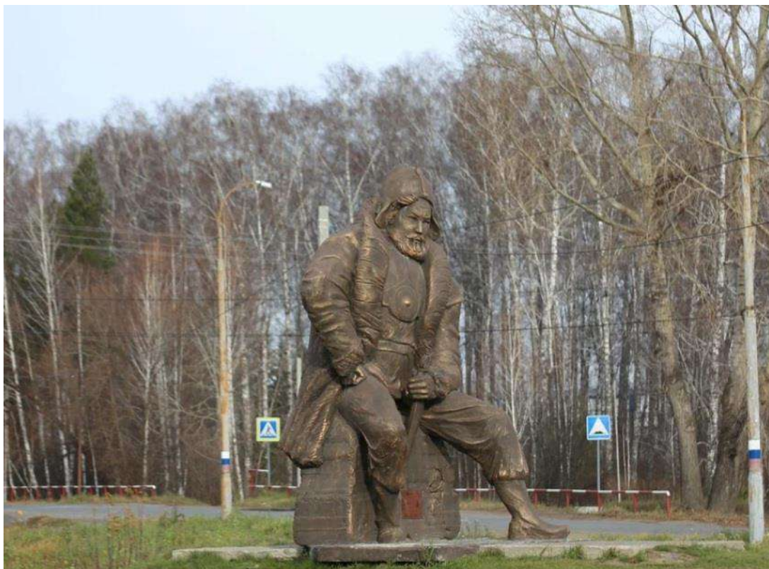
Фото №1 «Памятник завоевателю Сибири – Ермаку»