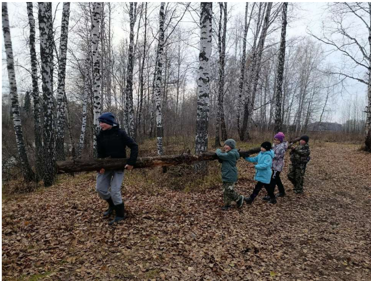
Фото №5 «Готовим место у костра»