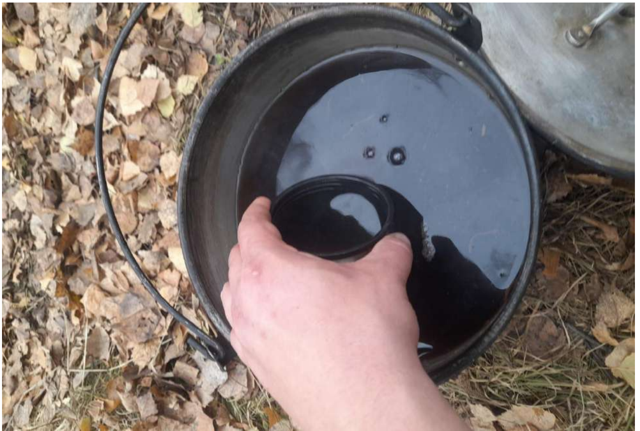
Фото №11 «Самый вкусный чай – чай , приготовленный на костре!»