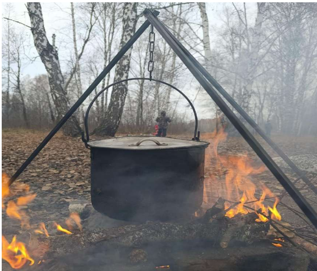
Фото №10 «Гори гори ясно»