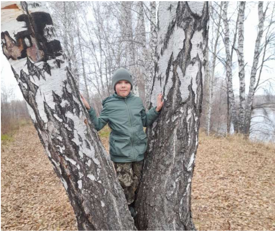
Фото №7 «Красота природы»