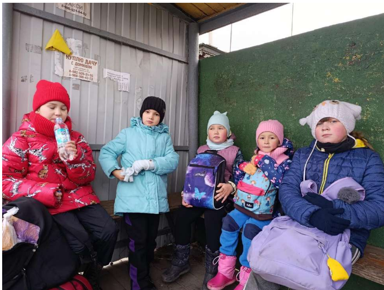
Фото №3 «Отдыхаем и снова в путь»