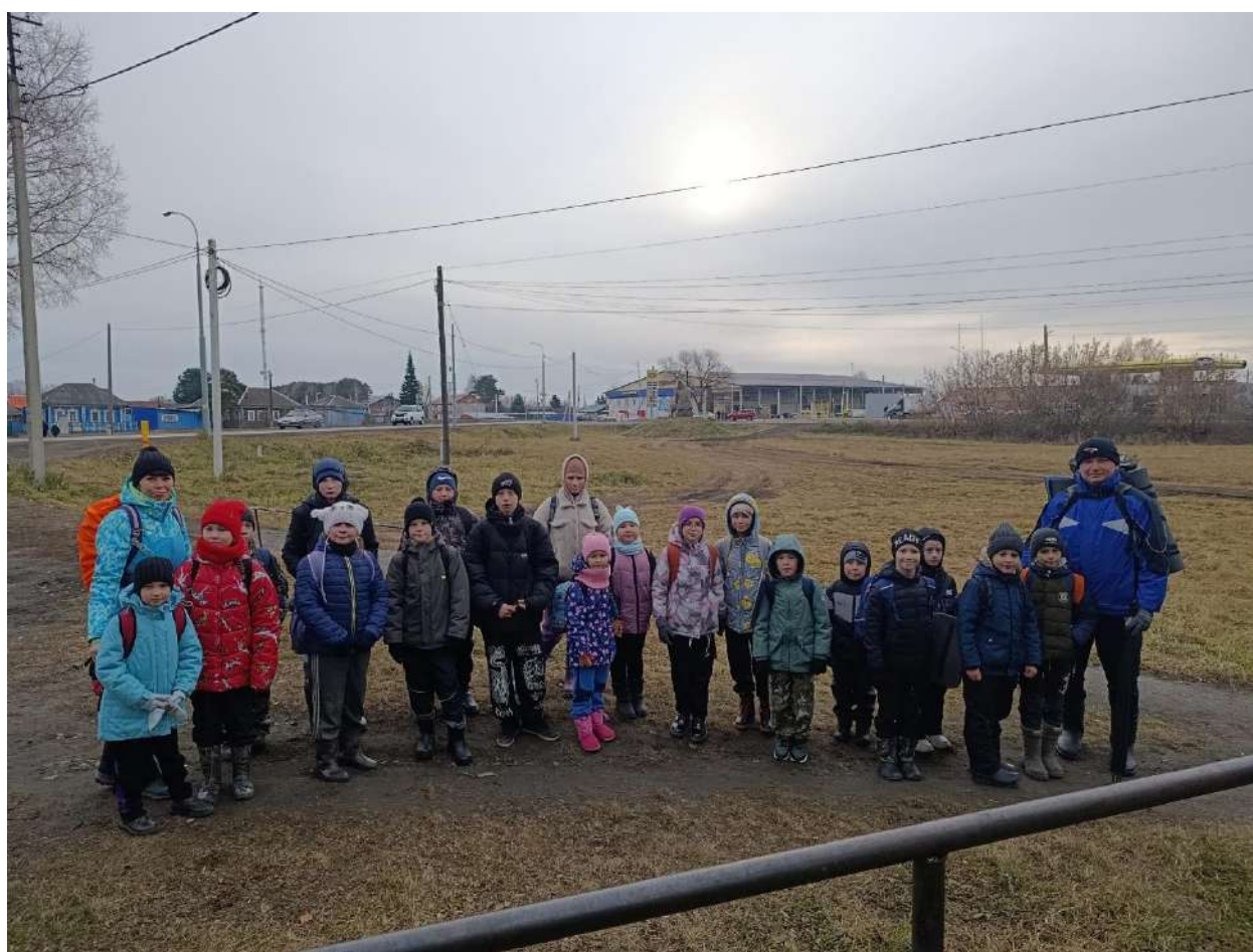
Фото №2 «Стартуем»