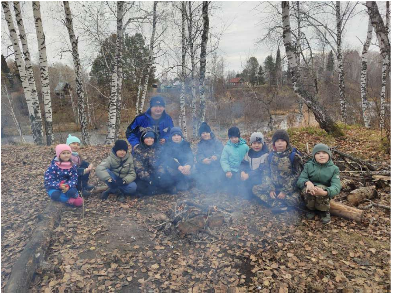
Фото №13 «Когда мои друзья со мной..!»