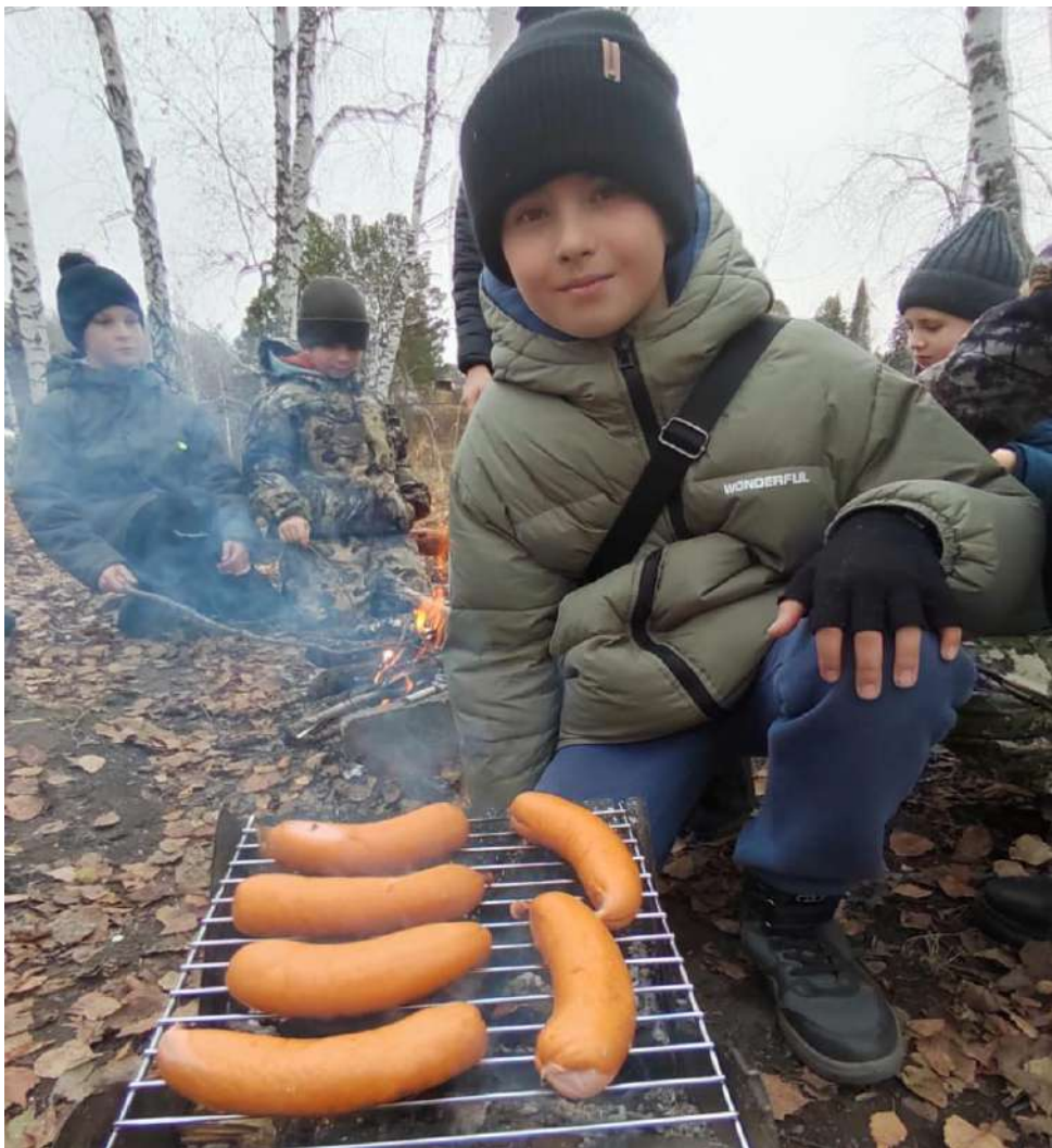
Фото №8 «Скоро будет вкусно!»