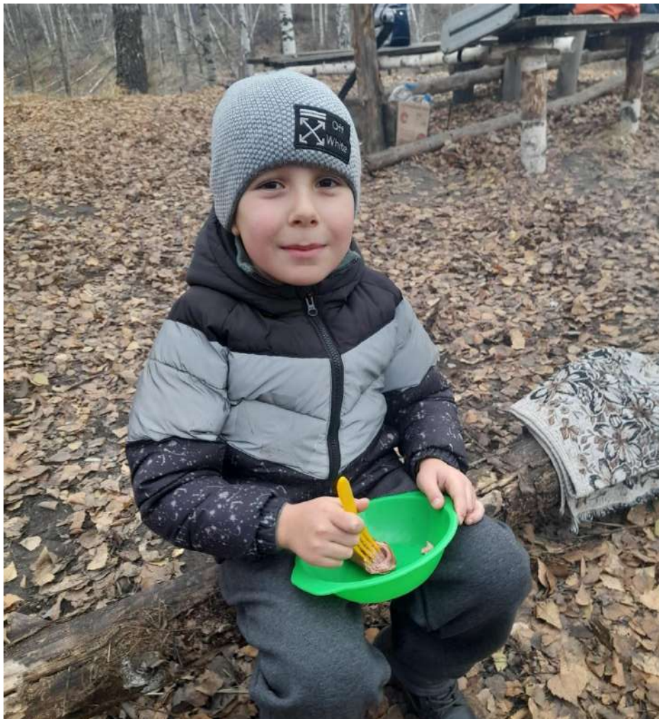
Фото №9 «Было очень вкусно!»