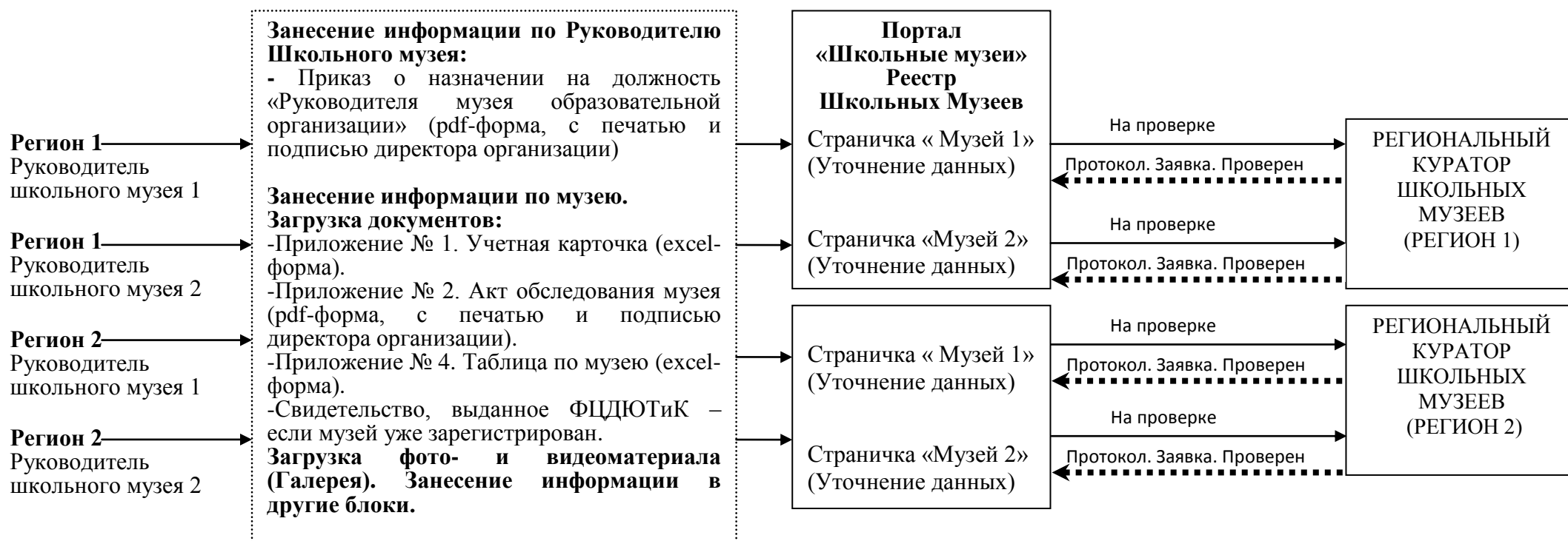
СХЕМА 1 Взаимодействие «Руководитель Школьного музея» – «Региональный Куратор Школьных музеев»