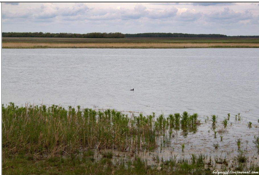
Озера Камышловского лога