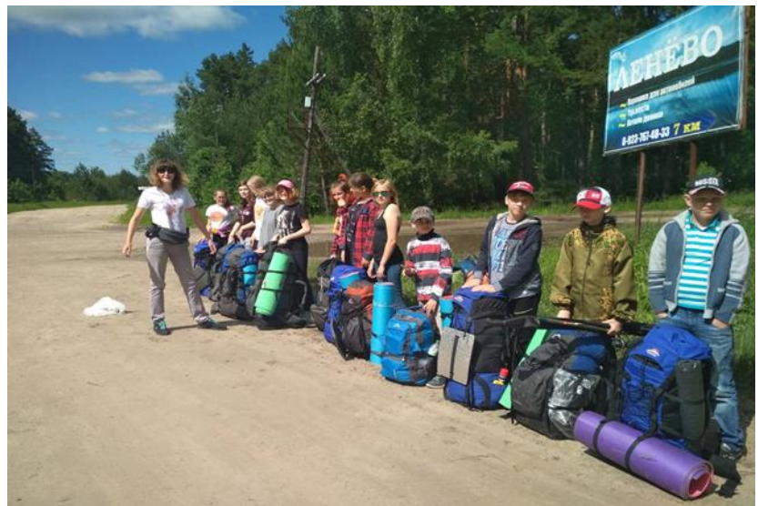
Начало маршрута. Поворот на оз. Линево.