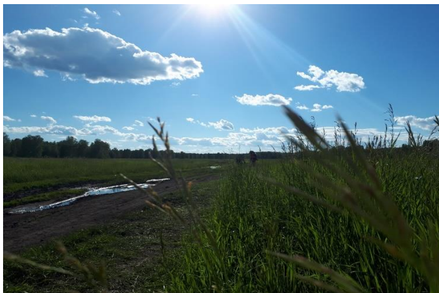
Путь с оз.Линево на оз.Данилово