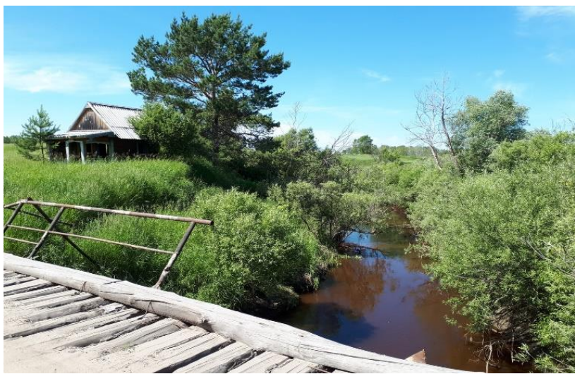
Мост через р.Нижняя Тунгуска