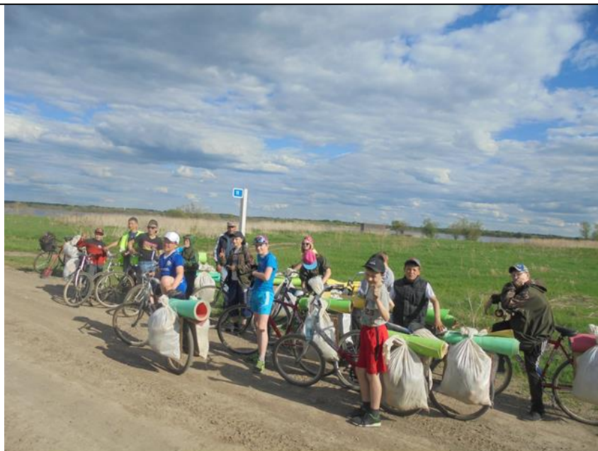
Место расположения д. Изюк