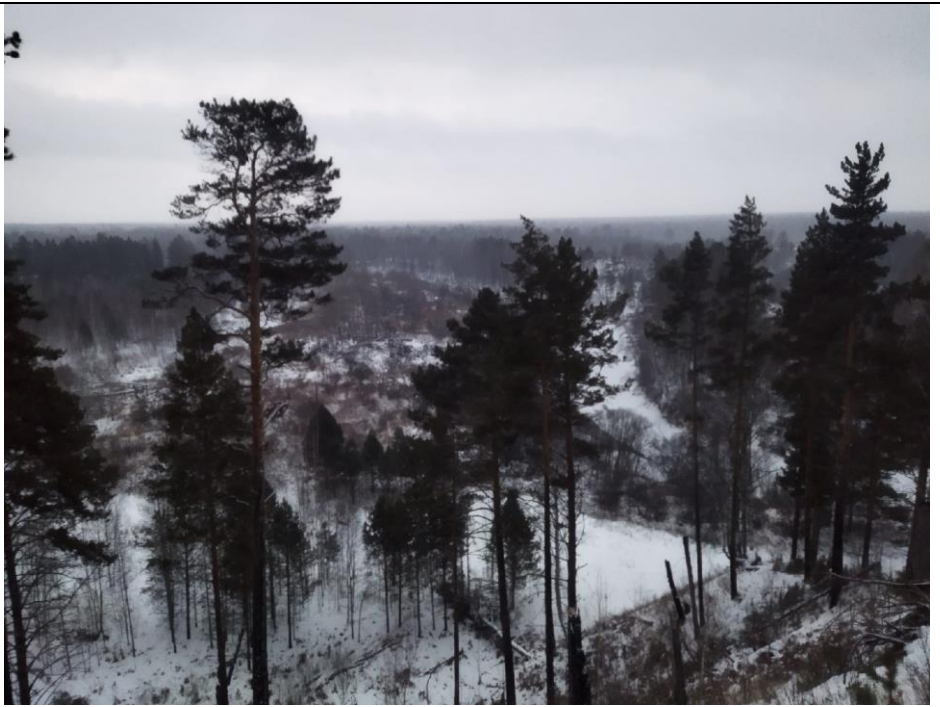
Вид с Кучум горы